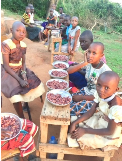
Lunch hos några barn från dövskolan.

Bild ovan. Planering av yta för nya övernattningshuset + tillverkning av tegelstenar. Vi har tillverkat 2710 tegelstenar för detta ändamål.