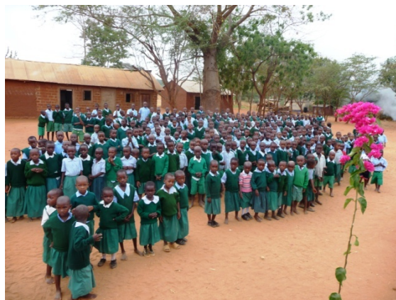
Stora årskullar i Mutomo primary School (ovan) och Sallen School i Mutomo (nedan).

Dröm eller verklighet? Ja, vi kommer att kämpa för detta drömscenario som kanske kan bli verklighet om 30-50 år. Även om vi själva inte kan åstadkomma detta så kan vi ialla fall ge Kenyas ungdom en chans till bättre levnadsvillkor än sina föräldrar. Låt oss alla i föreningen Mutomoprojektet hjälpas åt.