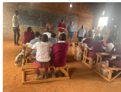
Mutha Sec. School

Skolbesök; Mutha, Eric School, Sallen School, Kiange, Dövskolan och Kyatune gav många bestående intryck hur verksamheten fungerar i Kenya.