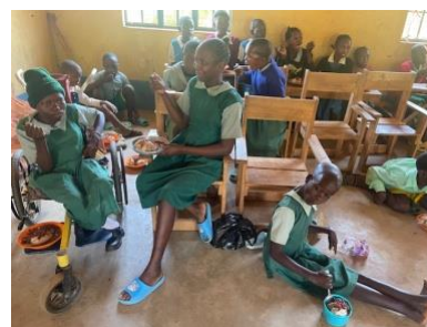
Lunchsat på Mutha Special School

I år tog vi oss tid att besöka fadderbarn som stöttades av av våra gäster från Sverige.