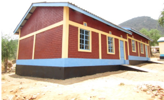
Mutha 2 nybyggda klassrum

Skolor: I början på året avslutades renovering och nybyggnation av Mutha Primary School och Mutha Special school. Ett stort projekt på nära 1,5 milj. Kronor med bl.a. 4 renov. Klassrum, 3 nya klassrum, 8 latriner, matsal, 4 vattentankarlärarrum, hönsgård. Total 700 barn. Stort tack till Lintex AB i Nybro.