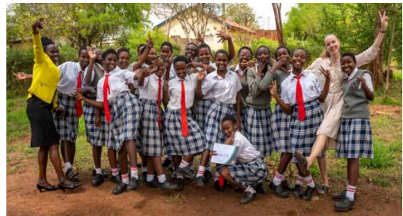
Glada flickor från Mutomo Girls gymnasium som deltar i projektet JA

entreprenörent. Återkommer om detta efter första teståret.