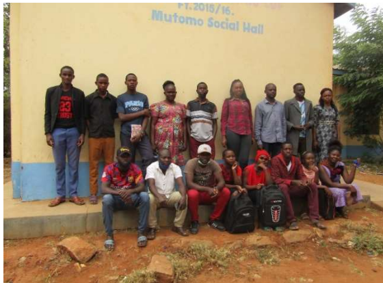
Volontärer under utbildning

Idrott: Vår egen Sport Academy växer för varje månad, då fler och fler bar strömmar. Flickor och pojkar från 12 års ålder. Aktuellt problem är att få hjälp av volontärer. Normalt sett är kenyaner vana med att få betalt för erlagt arbete. Vår information har givit resultat och just nu lär vi upp 17 nya volontärer som ska hjälpa vår sportledare Patric att ta hand om den ökande strömmen av barn som vill vara med.