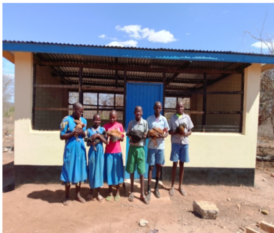
Mutha: Höns- Utbildning- äggförsäljning

Dövskolan i Mutomo har tack vare donatorer fått ett nytt övernattningshus för flickor. Dövskolan är mycket populär och elever från stora delar av östra Kenya vill gå där, men begränsas p.g.a. brist på sängplatser.