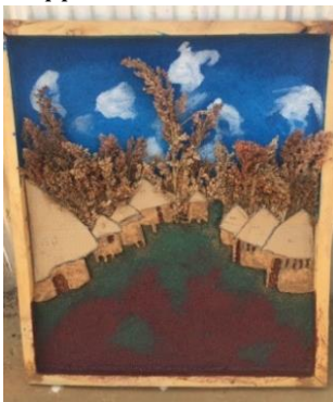
Tavla utförd av elever i Konstgruppen