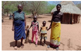
Mormor, mor och 2 yngre syskon