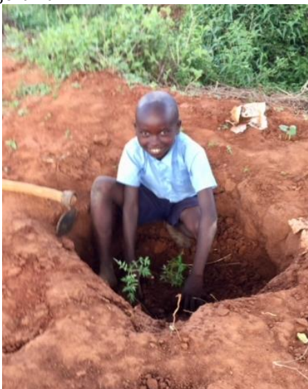
Leverans av trädplanter klara att plantera.