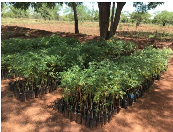
Från frö till planta. Klara för försäljning.