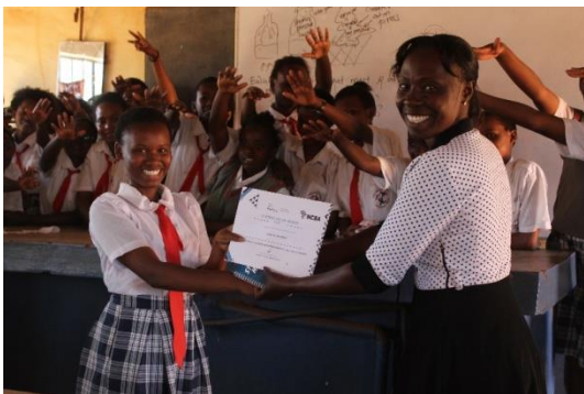
Stor glädje – diplomutdelning