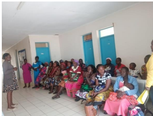
I väntan på behandling tar vi chansen till ytterligare information