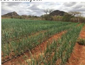
Lök på Stenland

I vår strävan att förbättra befolkningens kunskaper inom jordbrukssektorn kombinerar vi med att visa våra egna odlingar och samtidigt ha gruppundervisning i olika byar ( 10 grupper i 10 olika byar/år) – mest för kvinnor. På sikt ger detta resultat samtidigt som vi skapar egna inkomster åt deltagarna. Grupperna får lära sig hur man driver upp plantor från frö till liten planta och omsätter det vid sina egna hus. Sedan säljer de plantorna som ger en bra och säker inkomst för familjen.