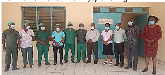
Lokal sjukvårdspersonal i Ikutha som hjälpte oss att genomföra projektet.

I august genomfördes årets Health Camp under 3 dagar i Ikutha (en stad 3 mil från Mutomo) i samarbete med stadens sjukhus. Varje år genomför vi en sådan riktad information till ett distrikt i Mutoområdet inom ramen för vår Familjeplanering.