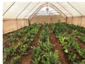
Kål i våra växthus