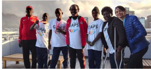
Representanter från Kenya. (Kalonzo 3:dje från vänster).