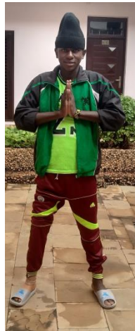
På väg till Trinidad