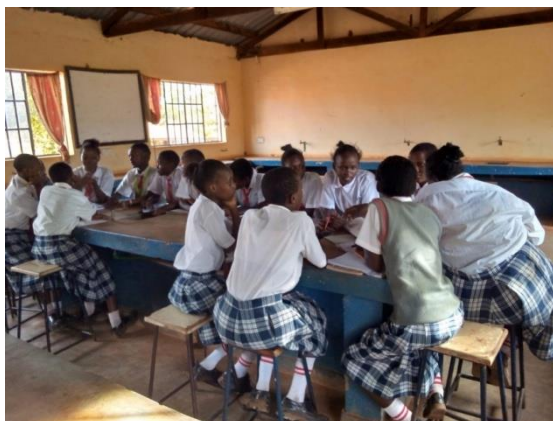
Här en grupp från Mutomo Girls sec. School.

571 patienter fick information och behandling gällande familjeplanering . 5 års- och 3 månadersimplantat (p-stavar) opererades in för att förhindra graviditet. Seminarier för familjer om nyttan med att reducera antalet barn/familj genomfördes. Även steriliseringar och vaccinationer. Några kvinnor fick också implantat bortopererade då det nu var lämplig tidpunkt att få ett planerat barn.